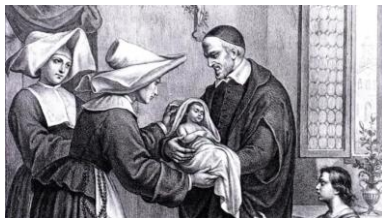
SAINT VINCENT DE PAUL FÊTE PATRONALE DE NOTRE ÉGLISE