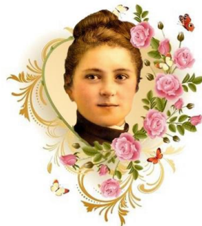
Sainte Thérèse de l'Enfant Jésus

L'amour embrasse tous les temps et tous les lieux. L'unique voie, c'est l'amour. L'amour est le chemin qui mène jusqu'à Dieu. L'unique voie, c'est l'amour. L'amour est feu brûlant au cœur des baptisés. L'unique voie, c'est l'amour. L'amour oublie le mal, il ouvre grand les bras. L'unique voie, c'est l'amour. L'amour est une espérance, il fait grandir la joie. L'unique voie, c'est l'amour. L'amour emplit d'audace les témoins du Christ. L'unique voie, c'est l'amour. L'amour est vérité, patience et paix du cœur. L'unique voie, c'est l'amour. L'amour pardonne tout, il ne s'éteint jamais. L'unique voie, c'est l'amour.